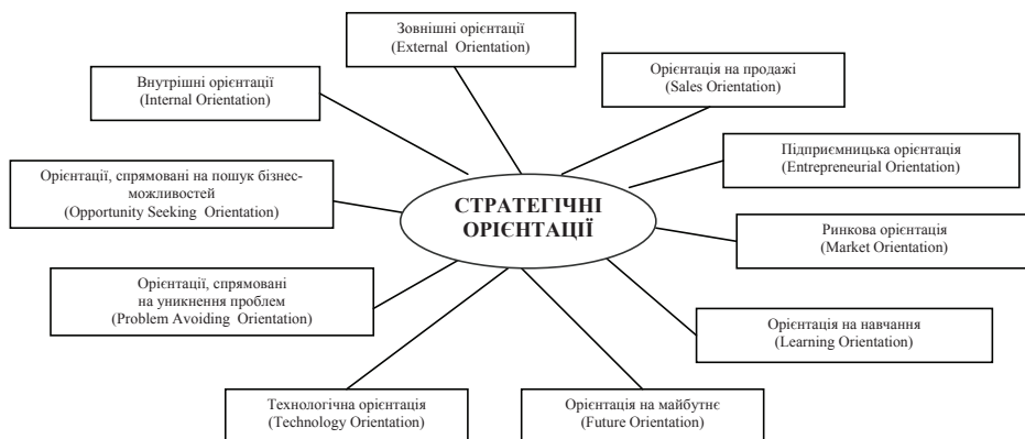
Рис. 3. Види стратегічних орієнтацій

Характеристики стратегічних орієнтацій фокусуються на різних принципах стратегічного управління і формують різні типи поведінки підприємства, що впливає на відмінності економічних результатів конкуруючих суб'єктів господарської діяльності.