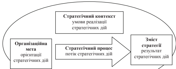
а) логіка триединого розуміння стратегії