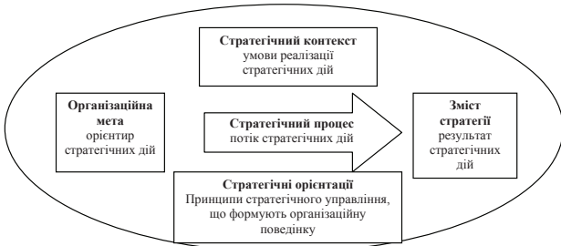
б) розширене бачення елементного складу концепції стратегії